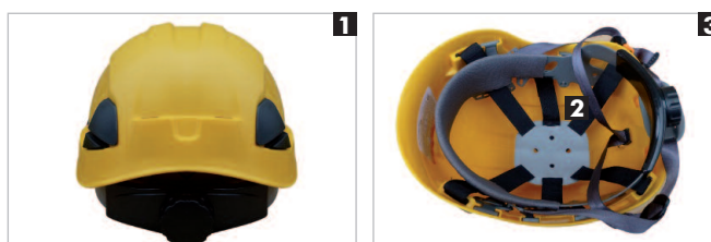
80668 Azul marino