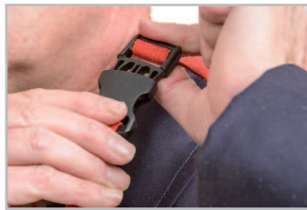
TIRAS ROJAS AL CUELLO