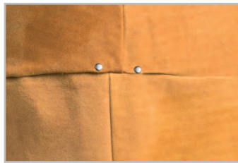
COSIDO EN 4 PIEZAS

Tiras rojas de algodón cosidas con hilo kevlar®.